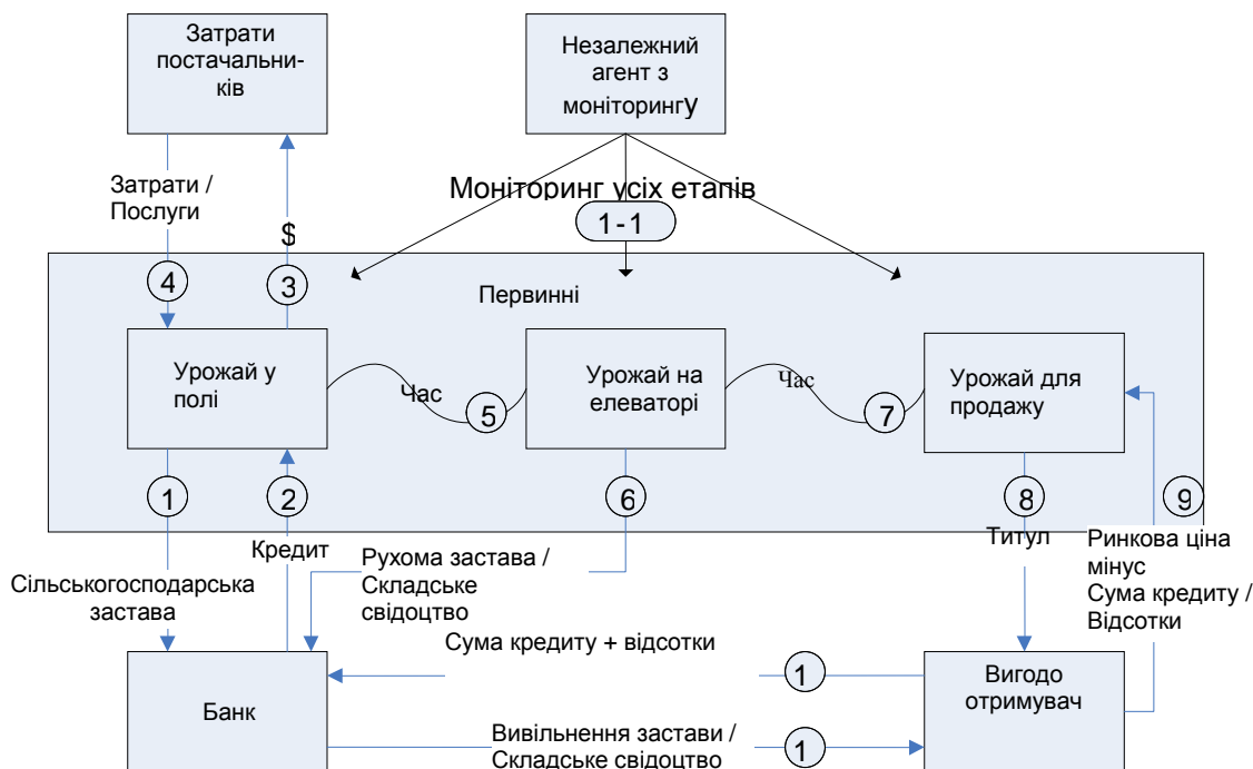
Рис. 2. Схема застосування CPR під майбутній урожай у Бразилії

Схема функціонування CPR у Бразилії представлена на Рис. 2.