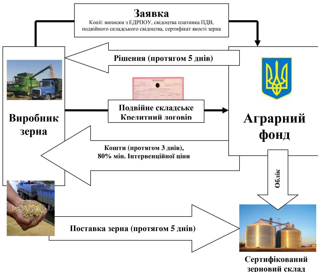
Рис.3. Схема механізму отримання бюджетної позички під заставу наявного зерна.

Слід зазначити, що бюджетна позика із застосуванням режиму державних заставних закупівель зерна надається Аграрним фондом виробникам зерна, яке є об'єктом державного цінового регулювання, щороку у період з 1 липня поточного року до 1 квітня наступного бюджетного року під заставу такого об'єкта в межах коштів, передбачених у державному бюджеті, але не менше 80 відсотків розміру мінімальної інтервенційної ціни. При цьому Аграрний фонд забезпечує ведення обліку зерна, що надійшло як застава відповідно до кредитного договору (рис. 3).