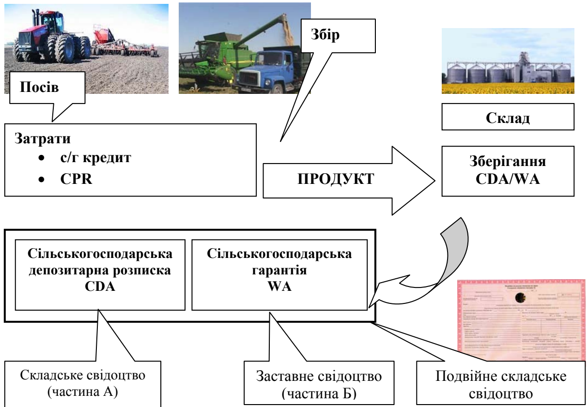
Рис 4. Перехід CPR у складські документи та їх інтеграція у Бразилії 2

Бразильська система фінансування під заставу майбутнього врожаю є складною відкритою динамічною адаптивною системою, яка постійно розвивається та самовдосконалюється.