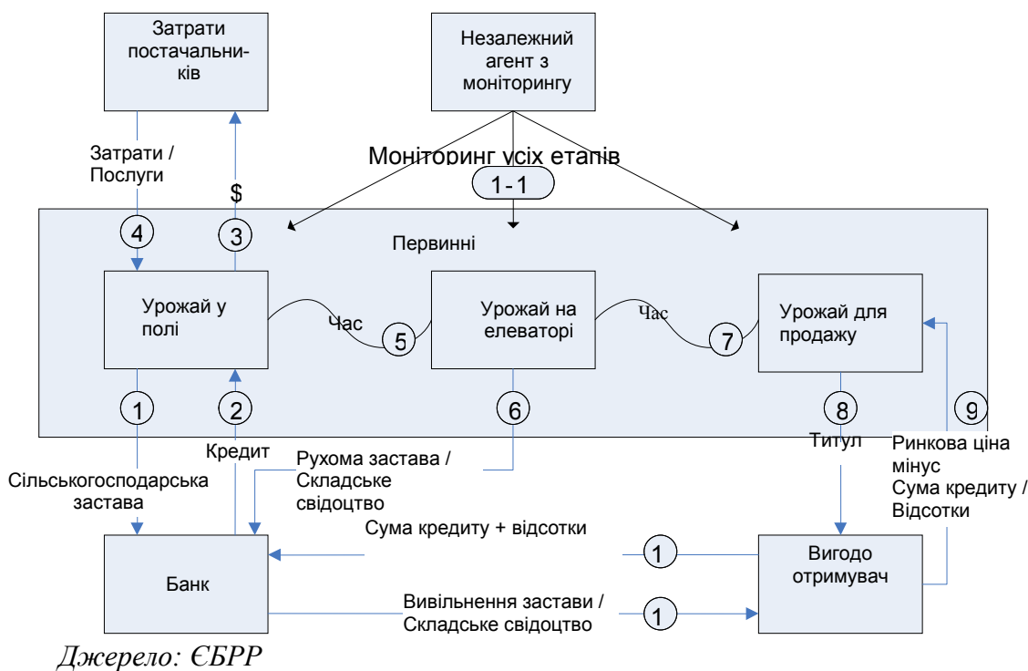
Рис. 2. Схема застосування CPR під майбутній урожай у Бразилії

позичальник має дуже обмежені можливості заперечення /оскарження такого рішення про звернення стягнення [4].